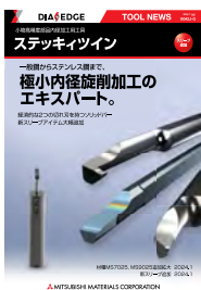
ステッキツイイン